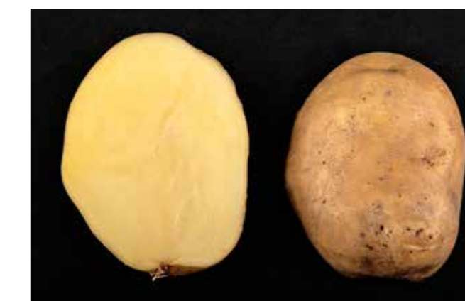
Abbildung 1 | Acoustic ist eine Speisesorte des Kochtyps B mit gutem Ertragspotenzial. Acoustic wurde vom Unternehmen Meijer in den Niederlanden gezüchtet. Diese Sorte weist eine sehr gute Resistenz gegenüber der Kraut- und Knollenfäule auf und benötigt weniger Pilzbehandlungen während der Vegetationsperiode. Sie bildet kurzovale bis runde Knollen und ist mässig anfällig gegenüber anderen Krankheiten.

Viele Sorten lassen sich nicht einem einzelnen Kochtyp zuordnen, sondern bilden Übergangstypen. So bedeutet die Zuordnung einer Sorte zum Kochtyp B-C, dass die Eigenschaften des Typus B vorherrschen, während bei einem Kochtyp C-B jene des Typus C bestimmend sind.