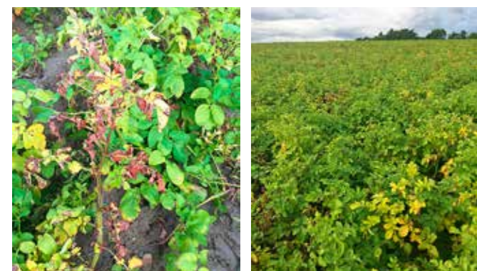
Abbildung 3 | Die Verticillium-Welke ( Verticillium spp.) und die Colletotrichum-Welkekrankheit ( Colletotrichum coccodes ) entwickeln sich vor allem nach sehr trockenen und heißen Zeiträumen. Beide Krankheiten können gleichzeitig bei derselben Pflanze auftreten. Die Erregerpilze kommen im Boden vor und infizieren die Pflanzen über die Wurzeln und Stängel. In diesem Agria-Feld wurden im August vorzeitig vergilbende und dann absterbende Pflanzen beobachtet. Die Anzahl der befallenen Pflanzen in der Parzelle kann schnell ansteigen.

Bereits 2017 kam es in einigen Kulturen zu vorzeitiger Vergilbung und Braunverfärbung der Pflanzen (Abb. 3). Bei einigen Pflanzen verwelkte und trocknete die Hälfte der Blätter ein. In den folgenden Tagen breitete sich das Phänomen auf andere Pflanzen der Parzelle aus. In diesen Kulturen war das gewünschte Kaliber leider trotz einer ausreichenden Bewässerung noch nicht erreicht worden. Die Diagnose im Labor ergab eine Erkrankung der Pflanzen an der Verticillium-Welke ( Verticillium spp.) und an der Colletotrichum -Welkekrankheit ( Colletotrichum coccodes ). Diese beiden Krankheiten können auf der gleichen Pflanze einzeln oder gleichzeitig auftreten.