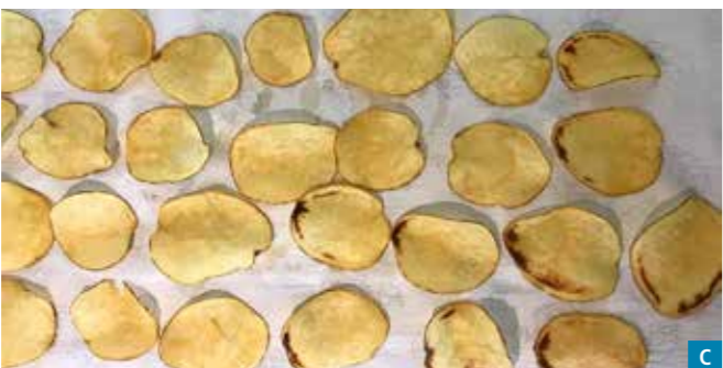
Abbildung 4A, 4B und 4C | Hohe Konzentrationen des Erregers der Verticillium-Welke ( Verticillium dahliae Kleb.) wurden in den Knollen in den braun oder grau verfärbten Bereichen der Gefässbündel auf der Seite der Stolonen nachgewiesen. Diese Bereiche verfärbten sich beim Frittierstest schwarz. Die Verarbeitungsarten Fontane, Piroi, SH C 1010 und Lady Alicia (Sorte in den Hauptversuchen) waren in den Jahren 2020 und 2022 besonders stark betroffen.

Impressum Herausgeber Layout Copyright Download Kontakt ISSN Agroscope, www.agroscope.ch Christoph Meichtry, Valmedia AG, Visp © Agroscope 2022 www.agroscope.ch/sortenlisten ruedi.schwaerzel@agroscope.admin.ch 2296-7230 (Online), 2296-7222 (Print)